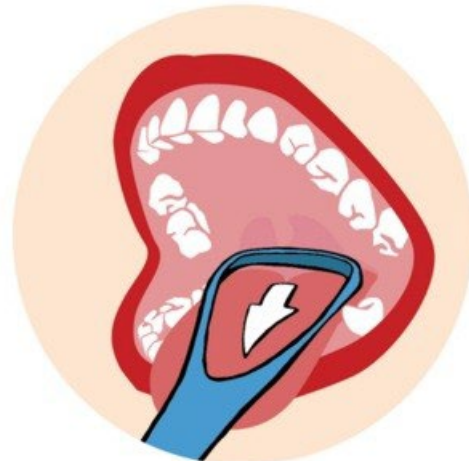
Figuur 5.2: Tongscraper